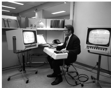
Bill English à la console Herman Miller, en 1968

Engelbart et son équipe s'attaquent ensuite à la réalisation d'un système logiciel utilisant ces dispositifs d'entrée pour produire et manipuler des connaissances. Ils s'appuient pour cela sur des éléments existants, comme le langage SNOBOL, mais étrennent également des principes d'ingénierie tels que la séparation entre interface et noyau fonctionnel ou la description de l'interaction par des machines à états