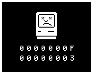
Écran indiquant un code erreur sur les premières versions de Macintosh fr.wikipedia.org/wiki/Macintosh

Comment éviter les bugs ? On peut bien sûr tester davantage les programmes. Cela permet de trouver beaucoup d'erreurs, mais combien d'autres passeront à travers les mailles du filet ? Une autre solution, c'est d'intervenir en amont dans le processus de création de programme, par exemple en fournissant aux informaticiens de meilleurs outils de conception, de meilleurs langages de programmation. C'est l'approche que prône Gérard Berry.