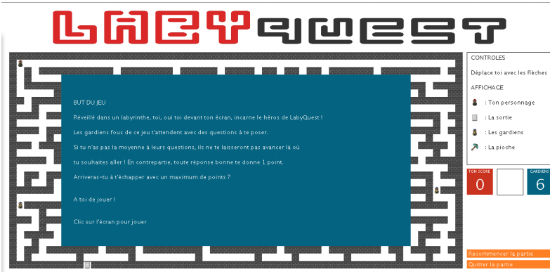
FIGURE 1. LabyQuest (E. Cattez) propose une interface graphique avancée dans laquelle un aventurier cherche à s'échapper d'un labyrinthe en répondant aux questions posées par des gardes.