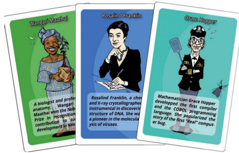
FIGURE 2. Jeu de cartes « Femmes de science », édité par Luana Games.

enfants : par exemple, la série Grey's Anatomy , qui donne une vision très diversifiée des scientifiques, ou le jeu de cartes québécois « Femmes de science » (Figure 2).