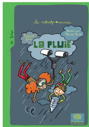
Couverture de la minipomme du savoir « La pluie ».

vulgarisation scientifique s'est dotée de plusieurs collections. Toutes cherchent à rendre accessible le savoir scientifique, à éveiller la curiosité et l'esprit critique. Toutes impliquent des scientifiques dans la conception des ouvrages. Chacune a, néanmoins, un processus de création et un cœur de cible qui lui sont propres. « Les minipommes » (ci-contre) sont un bel exemple de science participative : chaque volume est le fruit d'un échange entre une éditrice, un scientifique et une classe. Les « Math'Attak » et les « expériences » mettent en avant le côté ludique des sciences. Les « Tout sur... », avec leur présentation aérée, cherchent à intéresser des enfants peu friands de lecture. À l'opposé, les « Romans & plus junior » emportent les lecteurs dans des enquêtes policières, discrètement émaillées d'informations scientifiques. Les plus jeunes ne sont pas oubliés : avec « Les petits dégoutants », ils développent leur sens de l'observation et découvrent sous un autre jour des petits animaux souvent méprisés mais utiles, comme l'araignée, la limace, le ver ou le crapaud. Enfin, les enfants sont également invités à se hisser « Sur les épaules des savants » pour découvrir avec eux les horizons qui restent à explorer. Souvent avec humour, toujours avec passion, les éditions « Le Pommier » accompagnent les enfants (et les adultes) dans la découverte des sciences.