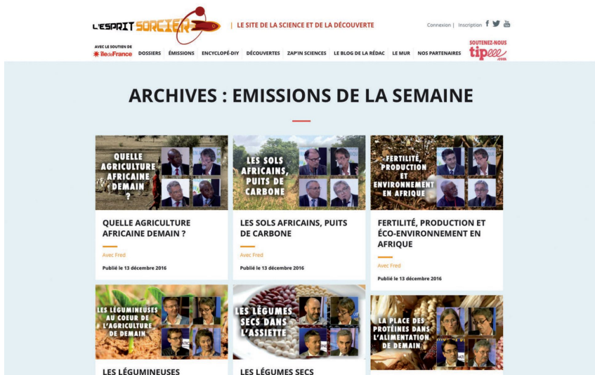
FIGURE 3. Capture d'écran d'une page « archives » du site « L'esprit Sorcier ».

sciences pour les jeunes, supprimée en 2013. Pour Fred, le succès rencontré par l'émission TV et la plateforme internet montre que les jeunes sont passionnés par la science, toute la science. ( Pour l'essentiel, les orateurs de la journée sont d'accord avec cette affirmation, en la restreignant aux jeunes de moins de 15 ans. ) L'accès à L'Esprit Sorcier est libre, gratuit, sans publicité. L'essentiel du financement vient de subventions institutionnelles (conseil régional d'Île-de-France), plateforme de crowd funding (financement collaboratif) « kisskissbankbank »... L'équipe de L'Esprit Sorcier est composée d'une quinzaine de personnes. Un sujet par semaine est présenté. Quelques questions sont posées en fin de sujet pour alimenter la discussion, qui est très animée sur internet.