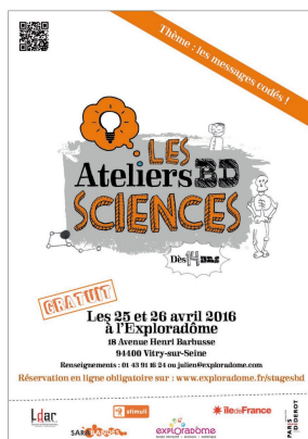
Affiche d'un atelier BD organisé par le collectif Stimuli.