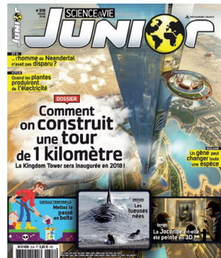
Couverture du numéro 318 de Science et Vie Junior .