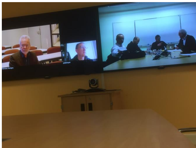
Le comité de pilotage IFIP France en réunion le 7 mars.

représentants de la France au sein des TC de l'IFIP, et les relations entre l'IFIP et l'UNESCO. Une journée IFIP France est prévue le 20 juin à Paris.