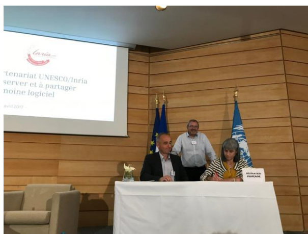
Signature de la convention SIF-UPS