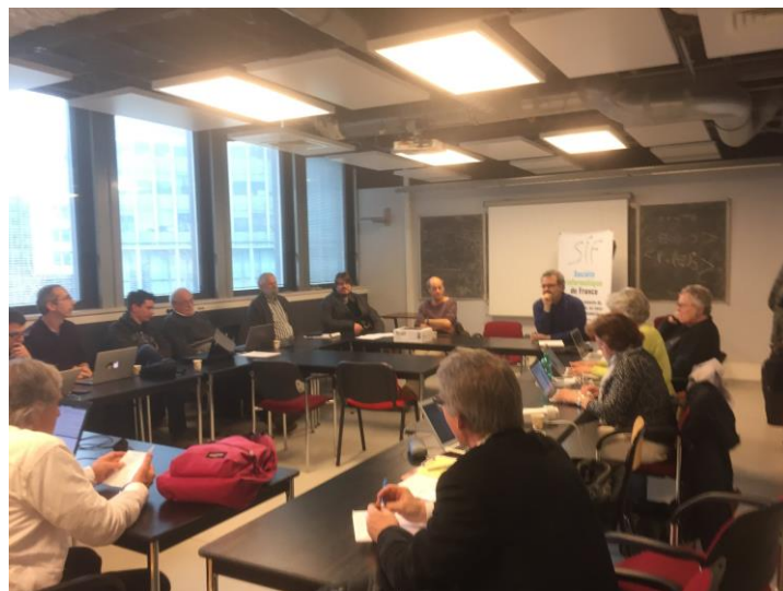
Le Conseil des associations en réunion le 1er février.