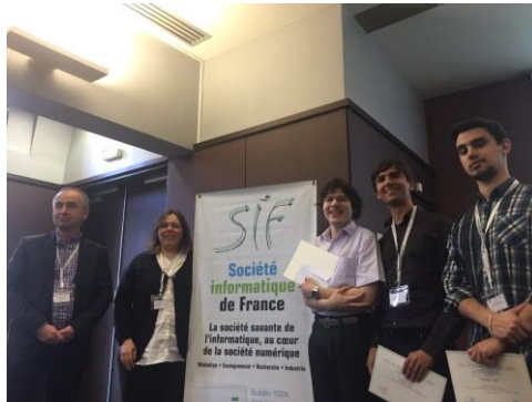
La remise du prix Gilles Kahn 2016