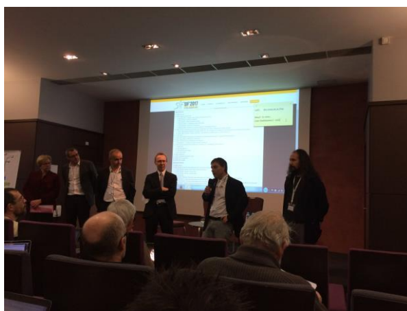
Ouverture du congrès 2017