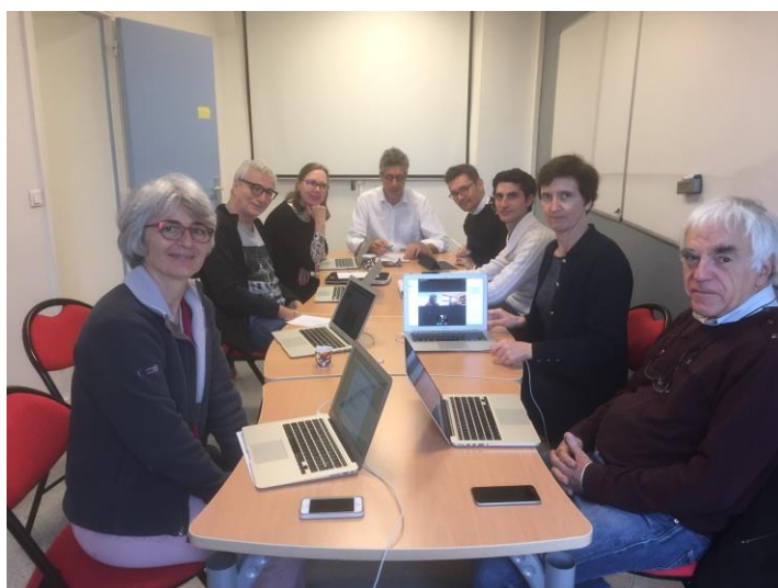
La réunion du CS du 1er mars 2017