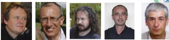
Rapport moral, Congrès SIF, Lyon, 5 février 2020